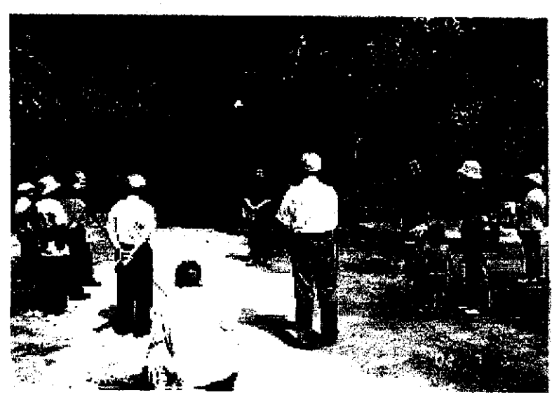
当日の様相 話しを聞くメンバー