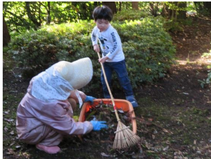
ぼくとおばあちゃん