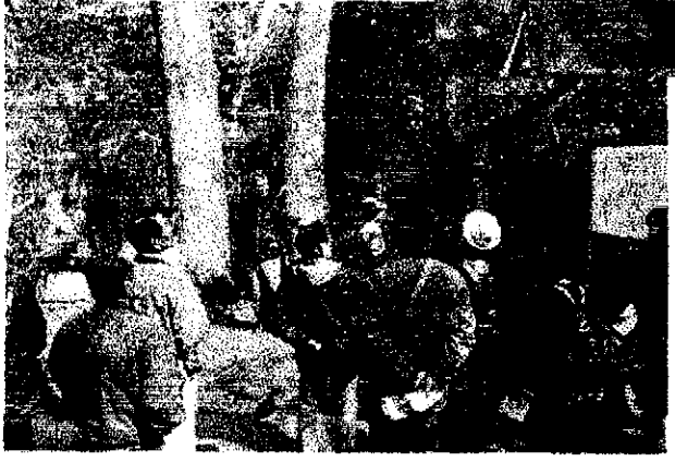
ブナ林の説明を聞く!